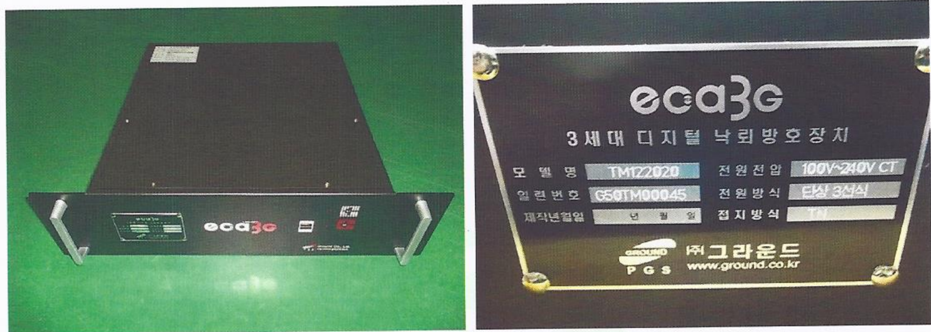
제품명 : 서지보호기(전원용) 형식명 : TM122020 정격전압 : AC 220 V